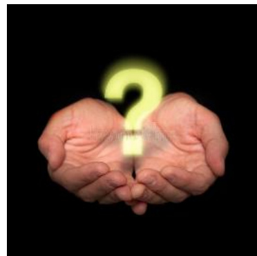
vroagt wij wat