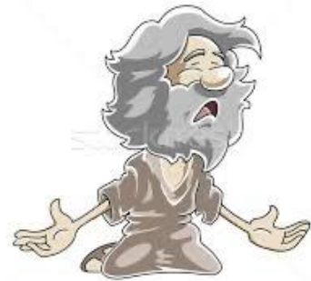
arme olde man