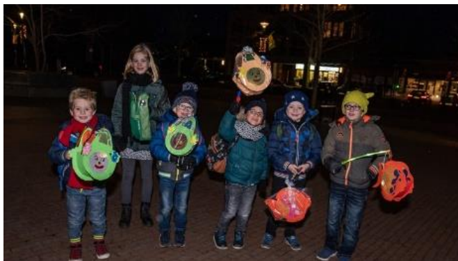
lope wij hier now an't pad